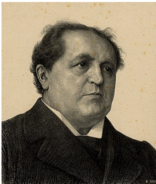
Kuyper en 1900, par Jan Veth.

Jusqu'au milieu de la deuxième moitié du XIX e siècle, les Pays-Bas ne connurent aucun parti politique avec une organisation nationale. Chaque circonscription comptait des associations d'électeurs de signature libérale, conservatrice, catholique ou anti-révolutionnaire. En 1879, Kuyper fonda le Parti anti-révolutionnaire ( Anti-Revolutionaire Partij (ARP)). Ce parti s'appropriait et organisait la pensée protestante, présente dans la société néerlandaise de manière latente depuis le début du XIX e siècle. Par le nom de son parti et par son programme politique, Kuyper se distanciant explicitement de la Révolution française, née du siècle des Lumières et qui mettait l'accent sur la souveraineté du peuple. Kuyper se faisait quant à lui l'interprète du « petit peuple », les kleine luyden , ces commerçants, agriculteurs et fonctionnaires, qui constituent encore aujourd'hui la base traditionnelle du CDA, parti issu de la fusion de l'ARP avec l'Union chrétienne historique (CHU) et le Parti populaire catholique (KVP) en 1980. Les Anti-révolutionnaires , ainsi que l'on prit l'habitude de désigner les partisans de l'ARP, étaient de fervents soutiens de la monarchie et défendaient les colonies et les territoires des Indes orientales néerlandaises, sous le prétexte d'être les serviteurs de Dieu . Le journal De Standaard , fondé par Kuyper à la même époque, fut étroitement lié à l'ARP.