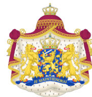
Chefs du gouvernement des Pays-Bas

Date de naissance 29 octobre 1837 Lieu de naissance Maassluis Date de décès 8 novembre 1920 (à 83 ans) Lieu de décès La Haye Parti politique Parti antirévolutionnaire Conjoint Johanna Hendrika Schaaïj Diplômé de Université de Leyde Profession Pasteur chrétien Journaliste Religion Église réformée néerlandaise